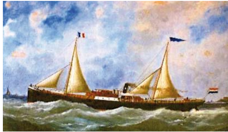
Stoomzeilschip Ary Scheffer 1, voor de Franse kust bij Le Havre.